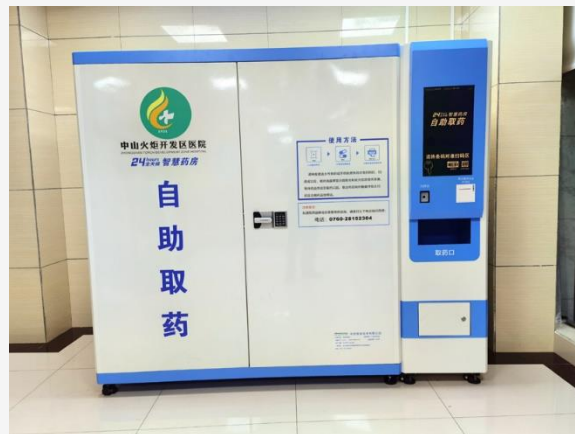
中山市火炬开发区医院