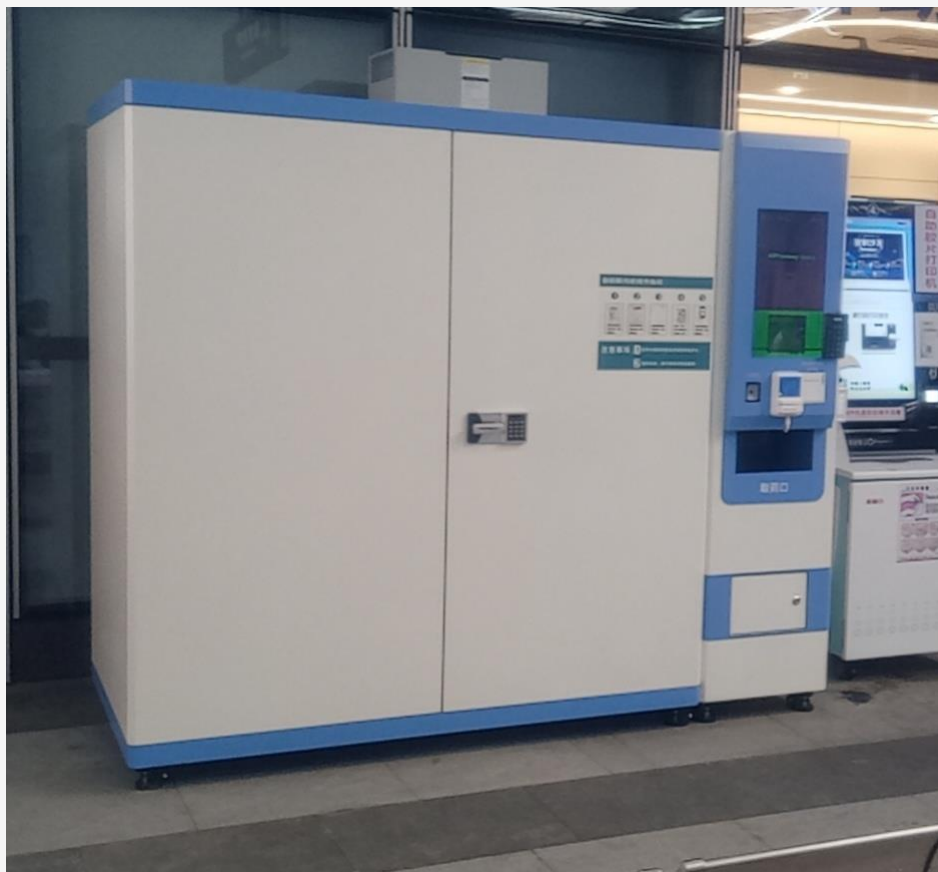
华中科技大学协和深圳医院