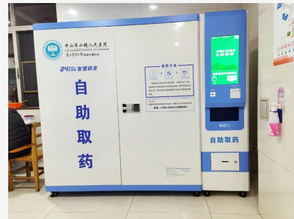
南方医科大学附属小榄医院