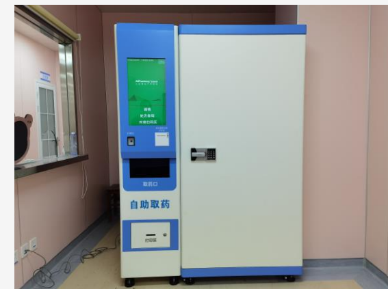
北京东城妇幼保健医院